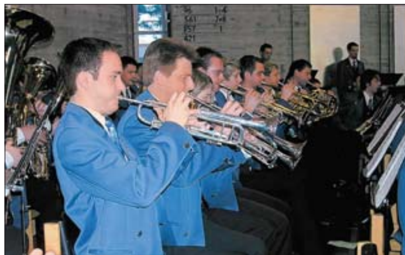
Werke bekannter Meister präsentierte die Stadtkapelle Oberkochen.